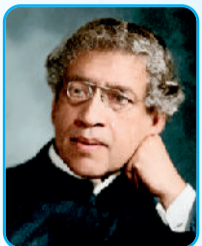
जगदीश चंद्र बसु

रेडियो के विकास में भारत का योगदान: वेसे तो पहला व्यावहारिक रेडियो 1895 में गुग्लिएल्मो मार्कोनी द्वारा बनाया गया था, लेकिन भारतीय वैज्ञानिक जगदीश चंद्र बसु ने 1895 में बिना तार के सिग्नल भेजने का प्रदर्शन कर दिया था। भारत में पहला रेडियो प्रसारण जून 1923 में बॉम्बे रेडियो क्लब द्वारा किया गया था। अपने देश का ऑल इंडिया रेडियो 99 प्रतिशत जनसंख्या तक पहुंच के साथ दुनिया के सबसे बड़े प्रसारकों में से एक है।