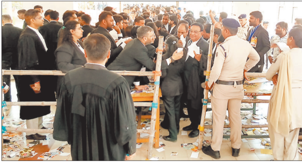
गुरुवार को छत्तीसगढ़ हाईकोर्ट बार एसोसिएशन चुनाव के दौरान अपनी पारी का इंतजार करते मतदाता।