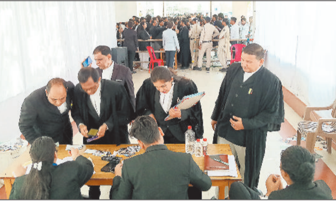
अध्यक्ष सहित 17 पदों के लिए 61 उम्मीदवार मैदान में

जो भीड़ को रोके रही और केवल वोटिंग करने आने वाले अधिवक्ताओं को ही अंदर जाने दिया जा रहा था। बथ के पहले ही सारे प्रत्याशी अपने-अपने पाम्पलेट देकर अपने पक्ष में वोटिंग करने के लिए अधिवक्ताओं से अपील करने में लगे हुए थे। बार रूम के कारिडोर से लेकर बाहर भी अधिवक्ताओं की भीड़भाड़ लगी रही। वोटिंग करने के लिए अधिवक्ताओं के आने का सिलसिला शाम तक चला, किन्तु दोपहर में अधिवक्ताओं की भीड़ ज्यादा नजर आई। हाईकोर्ट बार एसोसिएशन में कुल 1418 वोट हैं जिनमें से आज 1213 अधिवक्ताओं ने अपने मतदाधिकार का प्रयोग किया है। इस तरह से बार एसोसिएशन चुनाव में 85.54 फीसदी भारी वोटिंग हुई है। वोटिंग के बाद सीलबंद मतपेटियों को सुरक्षा व्यवस्था के बीच स्ट्रीट रूम में रखवा दिया गया है जो शनिवार सबह 10 बजे मतगणना के लिए बाहर निकाला जाएगा।