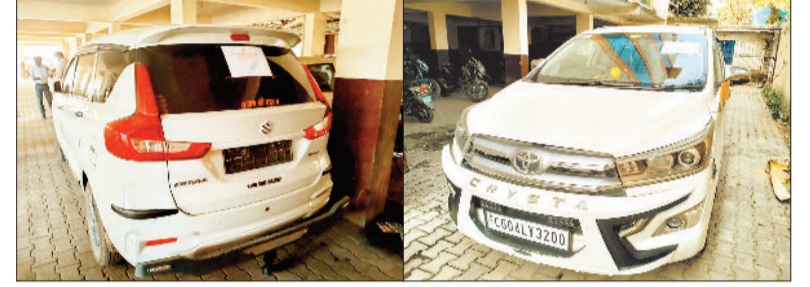
छापे के दौरान खड़ी गाड़ियां।