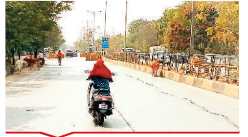
बिलासपुर-रायपुर मुख्य सड़क पर मवेशियों का जमावड़ा।