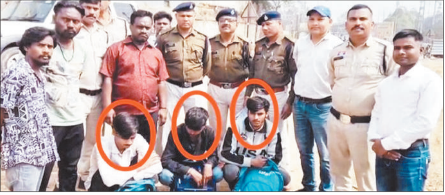
बिलासपुर